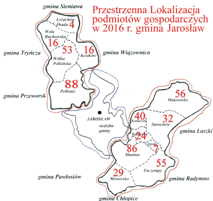
Rycina 3. Przestrzenna lokalizacja podmiotów gospodarczych w gminie Jarosław