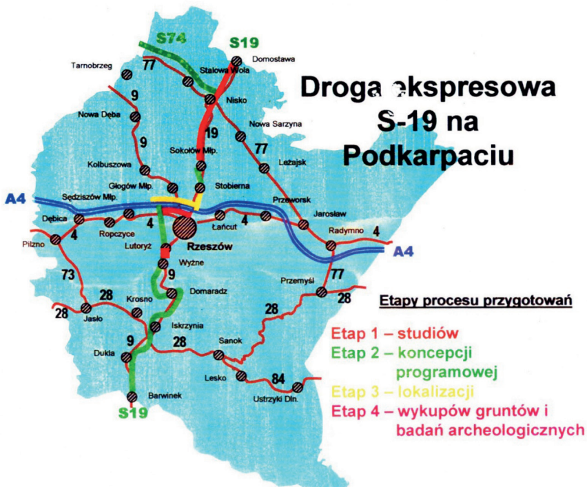
Rycina 2. Główny układ sieci transportowych w regionie podkarpackim