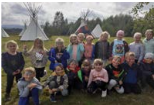
Rys. 5. Wycieczka do Zalasowej

Wycieczki to kolejna forma pełniąca wielorakie funkcje w edukacji. W przypadku, kiedy w klasie pojawiają się nowi uczniowie, bardzo istotną sprawą jest integracja grupy. Wspólne wyprawy zbliżają do siebie, sprzyjają zacieśnianiu przyjaźni w luźnej i oderwanej od szkolnych murów atmosferze. Dla nauczyciela stanowią podłoże poznania uczniów w sytuacjach innych, niż te szkolne. „Nigdzie młodzież nie żywa się wzajemnie tak jak na wycieczce, gdzie wszyscy mają wspólne cele, razem pokonują pewne trudności i muszą swoje osobiste wymagania podporządkować dobru grupy, nigdzie wychowawca nie pozna tak szybko swoich wychowanków i nie nawiąże z nimi bliskich, przyjacielskich stosunków” (Michalska, 2023). Już końcem września udałam się z moją klasą do wioski indiańskiej w Zalasowej, gdzie dzieci mogły poczuć się jak prawdziwi Indianie, strzelając z łuku, rzucając włócznią, śpiewając i tańcząc wokół wioski. Uczniowie wzięli również udział w warsztatach rękodzieła. Z okazji Mikołajek wybraliśmy się do Kopalni Soli w Bochni. Nie zabrakło również wycieczek w celu poznania najbliższej okolicy.