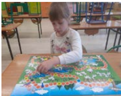
Rys. 10. Zajęcia dodatkowe z j. polskiego