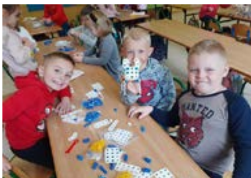
Rys. 4. Zabawy konstrukcyjne