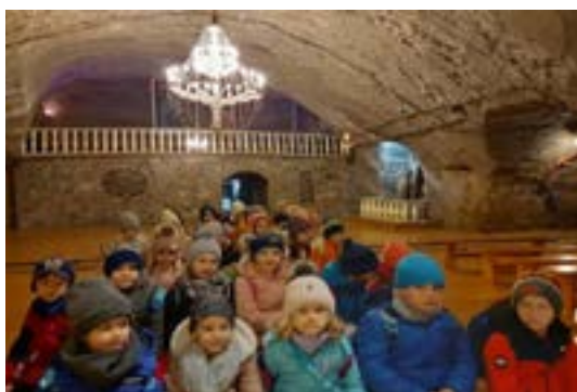
Rys. 6. Wycieczka do kopalni soli