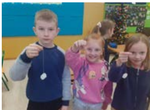
Rys. 2. Eksperymenty z wodą