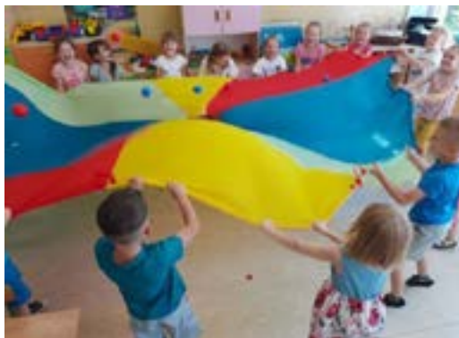
Rys. 3. Zabawy z chustą animacyjną

Zabawa dominującą formę aktywności dziecka. Nie może jej zabraknąć w edukacji wczesnoszkolnej. Przede wszystkim sprzyja wszechstronnemu rozwojowi dziecka, jest źródłem radości i relaksu. Według A. Klim-Klimaszewskiej „zabawa jest tym działaniem, które pozwala dziecku poznać lepiej świat, stosunki społeczne, kształci umiejętność społecznego działania, zaspokaja potrzebę ogólnej aktywności, a także tworzy pozytywne stany uczuciowe i rozładowuje napięcie emocjonalne” (Grabowski, 2011). Szczególnie w przypadku klas, do których uczęszczają uchodźcy, zabawa jest kluczowym elementem integrującym. Ułatwia kontakty między rówieśnikami oraz opiekunami, sprzyja zacieśnianiu relacji koleżeńskich oraz współpracy w dążeniu do celu i niejednokrotnie pozwala na odblokowanie swoich emocji, będących konsekwencją traumatycznych wydarzeń. Bardzo często korzystam z zabaw z chustą animacyjną, zabaw kołowych, ruchowych, relaksacyjnych oraz gier edukacyjnych.