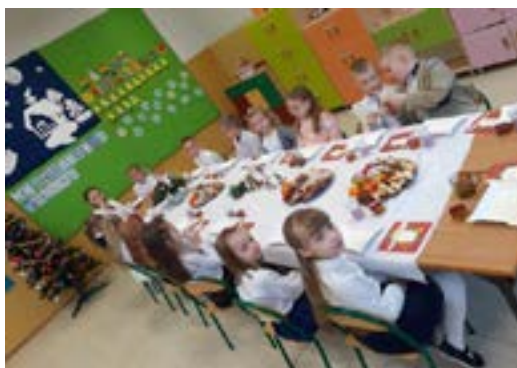
Rys. 8. Spotkanie opłatkowe