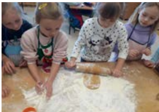
Rys. 7. Pieczenie pierników

Zasadniczym punktem w integracji przez edukację są „wspólne wydarzenia” klasowe. Te działania angażują wszystkich uczniów, dlatego też w wielkim stopniu oddziałują na relacje koleżeńskie oraz uczniów i wychowawców. Atmosfera panująca w klasie jest dla mnie bardzo istotna, to też wykorzystuje nadarzające się okazje, aby nadać im rangę klasowych wydarzeń. Oprócz świętowania urodzin i innych ważnych dni w roku organizuję również akcje, takie jak pieczenie pierników czy przygotowanie wspólnego wielkiego śniadania.