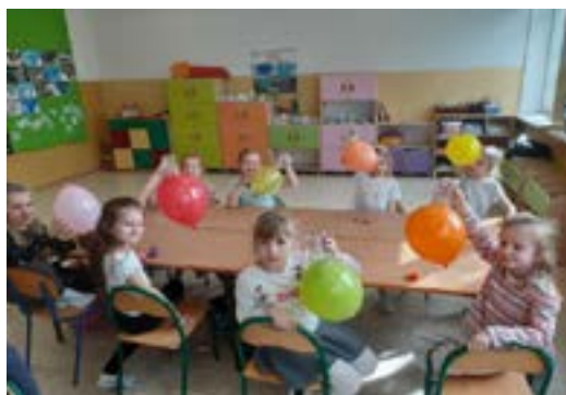
Rys. 1. Eksperymenty z powietrzem

Eksperyment to metoda będąca odpowiedzią na zainteresowania oraz naturalną ciekawość poznawczą dzieci w wieku wczesnoszkolnym. Nie ma lepszej metody na wyjaśnienie dzieciom w przystępny sposób, procesów i zjawisk zachodzących wokół nas, szczególnie w grupie, w której barierą stanowi język. Wykorzystanie tej metody narzucała konieczność stosowania rozmaitych środków dydaktycznych. Dzięki nim „można ilustrować abstrakcyjne pojęcia, prawa i teorie [...] a także pokazywać przedmioty i obiekty trudne lub niemożliwe do bezpośredniego postrzegania” (Dziurzyńska-Pyrasz i in., 2011), a to znacznie ułatwia komunikację.